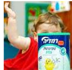
הנפגעים יפוצו